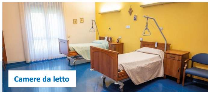
Camere da letto