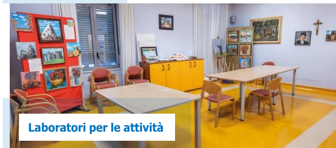
Laboratori per le attività