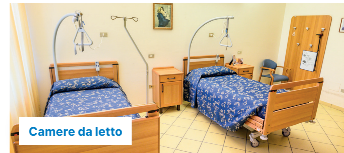
Camere da letto