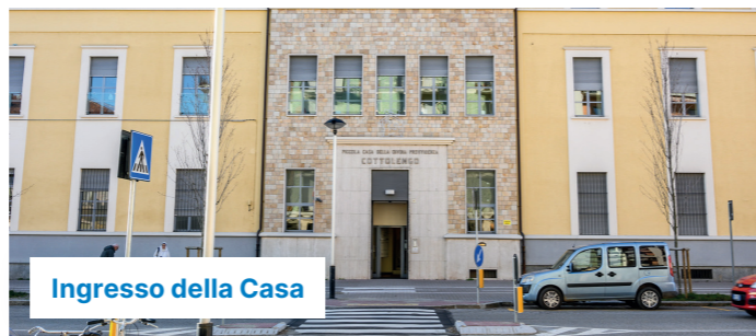
Ingresso della Casa

Ogni nucleo si avvale inoltre dell'ausilio di bagno clinico, servizi igienici collettivi, locali biancheria sporca e guardaroba per la biancheria pulita. La casa è dotata di ausili per le persone meno autosufficienti e di una palestra attrezzata con personale qualificato. All'esterno la Casa è circondata da un giardino usufruibile dagli ospiti e dalle persone che accedono alla struttura. La struttura è attrezzata di cucina e lavanderia interna.