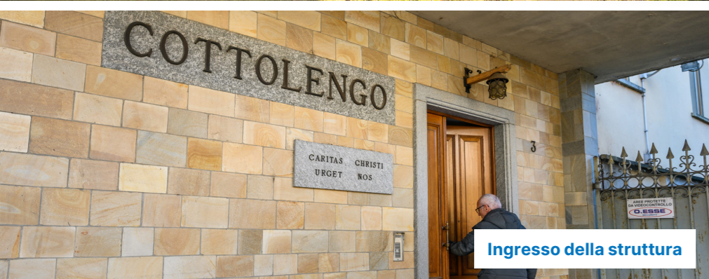
Ingresso della struttura