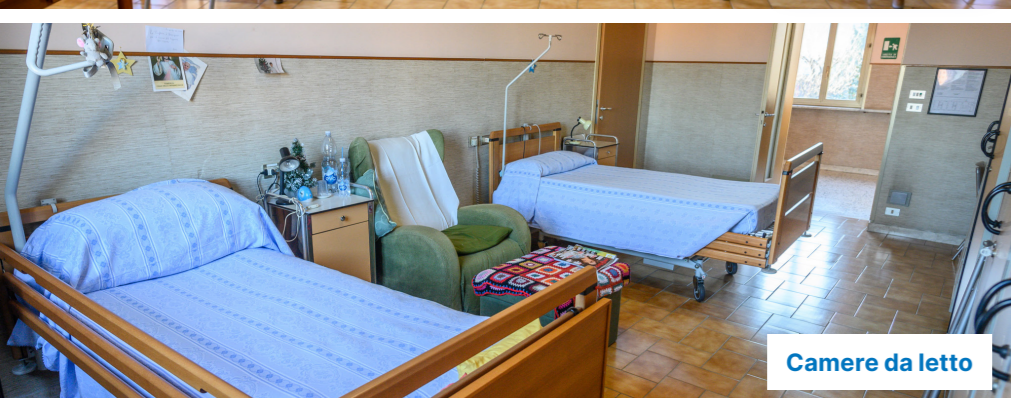
Camere da letto