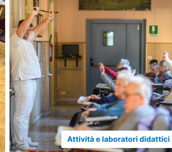
Attività e laboratori didattici